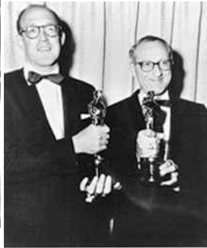
Jay Livingston - Ray Evans