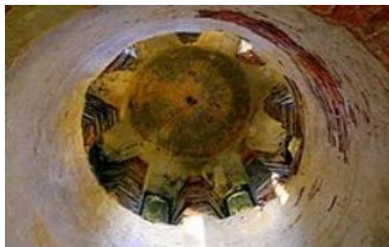
Kabeli tambuuri sisevaade.