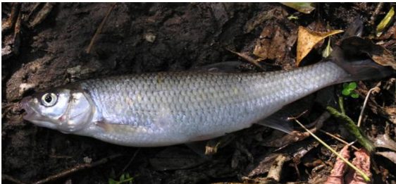
( Leuciscus leuciscus )

Küsime eriti Pärnu ja Emajõe ühenduses olevates väiksemates jõgedes, ojades ja järvedes ning riimveelises rannikumeres elutsevat kala .